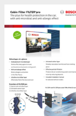
Informação de produto